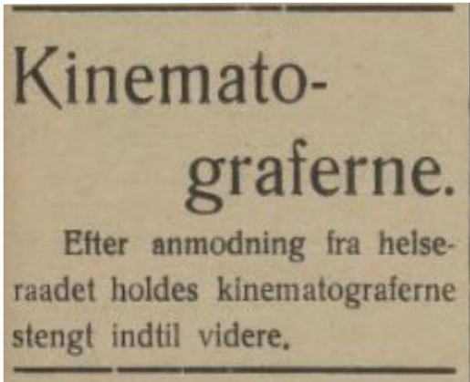
Moss Socialdemokrat. 19. oktober 1918.

Kinoene er verken overfylte eller blant de verste, hevder avisen. Samtidig hinter den også om at mange nettopp så på kinoene som et av de mer problematiske stedene å oppholde seg for å unngå å bli smittet. De tre (eller var det to?) kinoene i Kristiansund, der avisen kom ut, hadde ikke blitt kommunalisert høsten 1918, og enkeltindividets frie vilje var åpenbart viktig for avisen.