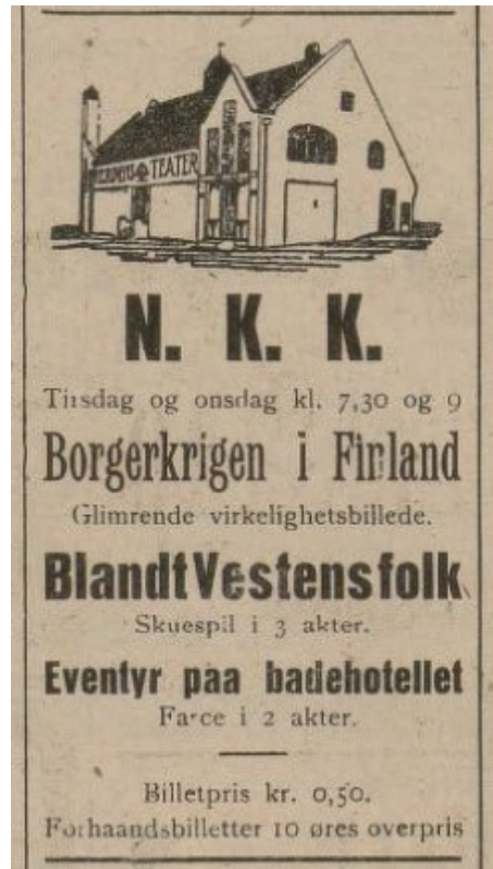
Ofotens Tidende, 10. september 1918.

Som nevnt åpnet Trondheim kinoene igjen 7. oktober, mens Skien stengte 9. oktober. I Kongsberg stengte kinoen 11. oktober, Arendal stengte sine to kinoer 15. oktober, Sandnes sin ene kommunale kino 22. oktober, Kristiansand stengte to kinoer 23. oktober, Stavanger hadde syv (eller var det åtte?) kinoer