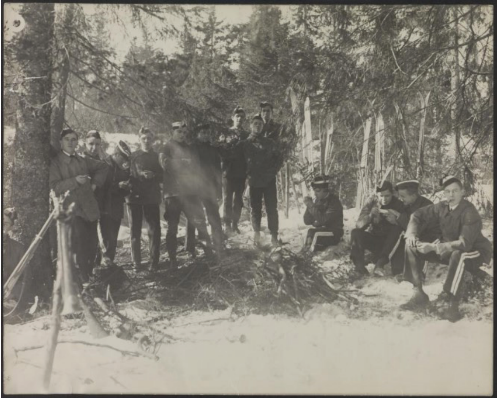
Stillbilde fra filmen Æresgjesten (1919). Garden hjelper til.

drev kinoer. Christiania Film Co., som var blitt etablert i 1916, hadde i motsetning til tidligere produsenter satset store ressurser på å bygge filmstudio, men hadde ikke egne kinoer til disposisjon. Selskapet hadde relativt omfattende produksjon, med hele ni spillefilmer fra 1916 og fram til begynnelsen av 1919. 21 Årsaken til at selskapet ikke satset på kinodrift, var trolig kinoloven fra 1913, som ga kommunene muligheten til å kontrollere kinodriften.