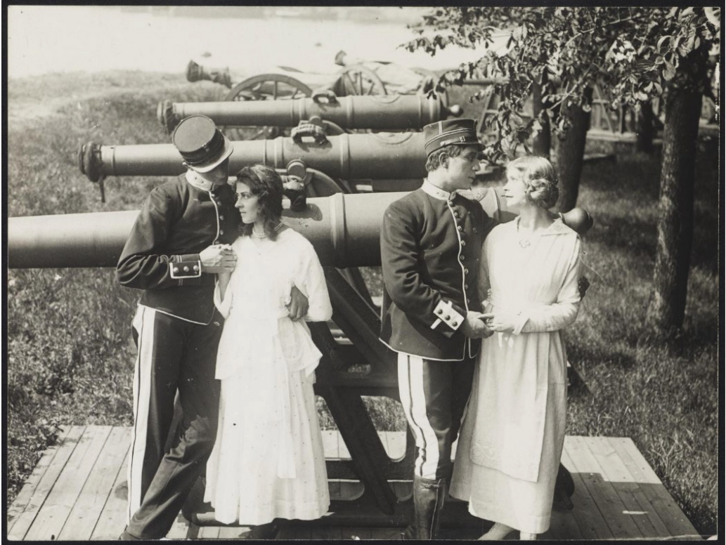
Sersjanten, upublisert spillefilm

skulle stenge, og nevnte ifølge en avis også sirkus i samme kategori som kinoene. 49