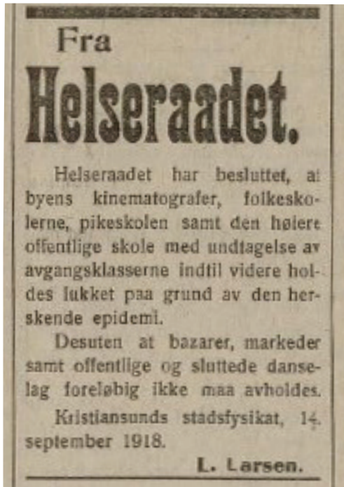
16. september 1918 (ikke avis hver dag)

i avisene, for mange så en (uheldig) sammenheng mellom skolene og kinoene. Og den sammenhengen hadde vært synlig for flere allerede en god stund. Under debatter om statlig forhåndssensur av film så tidlig som i 1909 og i 1911, som til slutt skulle lede til opprettelsen av Statens Filmkontroll høsten 1913, var det nettopp lærerne, sammen med kirken, religiøse organisasjoner og sedelighetsforeninger som gikk til kamp mot kinoenes moralske forfall. Stavanger Lærerlag hadde ledet an og funnet ut at i 1910 hadde 89,9 prosent av barna på folkeskolene besøkt kinoene. Konklusjonen da var at de voksne pedagogene mente «Det positive utbytte barnene har hatt av sine besøk paa kinematograferne, viser sig ved undersøkelse at være forbausende litet. [...] Utbyttet blir derfor som regel av meget tvilsom pedagogisk værdi». 43 Man nevnte at det fantes noen få unntak, for det eksisterte en idé om at film også kunne virke pedagogisk og lærende under spesielle forhold. Selv om statlig forhåndssensur hadde blitt innført siden den gangen i 1910, så mange i 1918 fremdeles ikke optimistisk på kinoenes påvirkning på barn. I hvert fall ikke (flere av) lærerne.