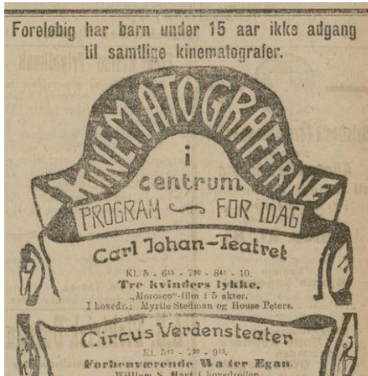
Utsnitt av kinoannone for hovedstadens kinoer. Barn under 15 har ikke adgang.

ikke ble ansett å være verken lyse eller luftige, selv ikke med lyset på. Og i kinoenes mørke foregikk det sikkert mye rart, med omfattende fysisk kontakt uten at foreldre eller skolelærere hadde kontroll. Filmsensuren var fremdeles i 1918 utformet slik at barn hadde adgang til å se alle filmer som ble vist, det var ingen skille på sensur for voksne og barn. Likevel kunne kinoene sette sine egne begrensninger ved behov, og barn hadde ofte ikke adgang til de senere forestillingene.